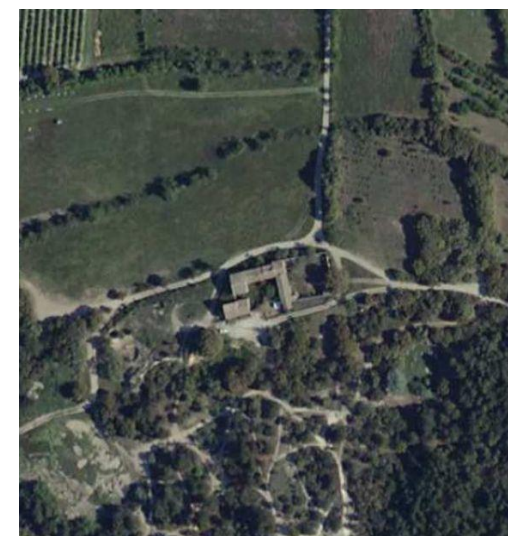
plan masse général