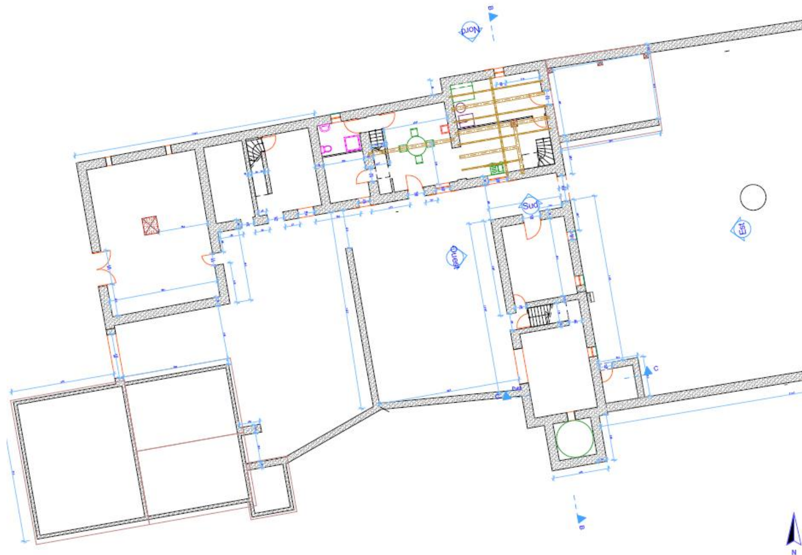
relevé complet des bâtiments et des cours avec l'aménagement intérieur du Rez-de-Chaussée